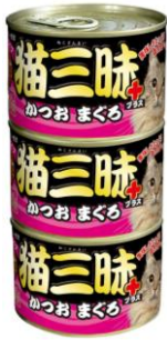
⑦猫三昧プラスかつおまぐろ 160g×3缶