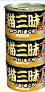
⑨猫三昧プラスかつおまぐろ ささみのせ160g×3缶