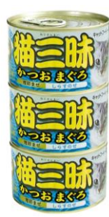
⑤猫三昧かつおまぐろ しらすのせ160g×3缶