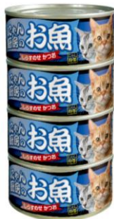
②にゃん厨房のお魚 しらすのせかつお 170g×4缶