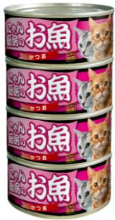
①にゃん厨房のお魚 かつお170g×4缶