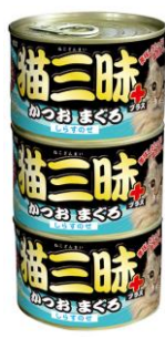
⑧猫三昧プラスかつおまぐろ しらすのせ160g×3缶