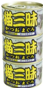
④猫三昧かつおまぐろ まぐろ節かけ160g×3缶