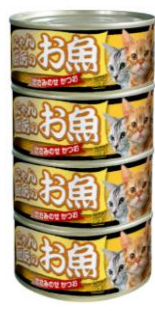
③にゃん厨房のお魚 ささみのせかつお 170g×4缶