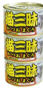
⑥猫三昧かつおまぐろ ささみのせ160g×3缶